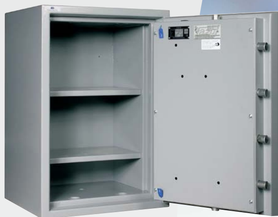
Modèle Dinami 412